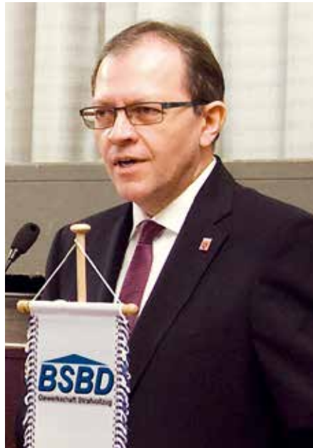
Staatssekretär Thomas Metz.

Metz wies auf die Gelder hin, die im Haushalt 2017 zur Förderung von Maßnahmen zur Deradikalisierung von Gefangenen im Vollzug vorgesehen seien,