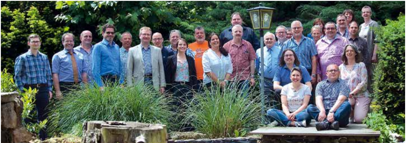
Im Bild der Landeshauptvorstand des BSBD Hessen.