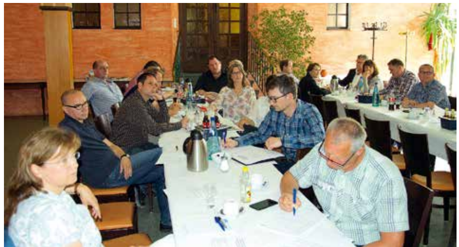
Blick in die Runde der Tagungsteilnehmer.